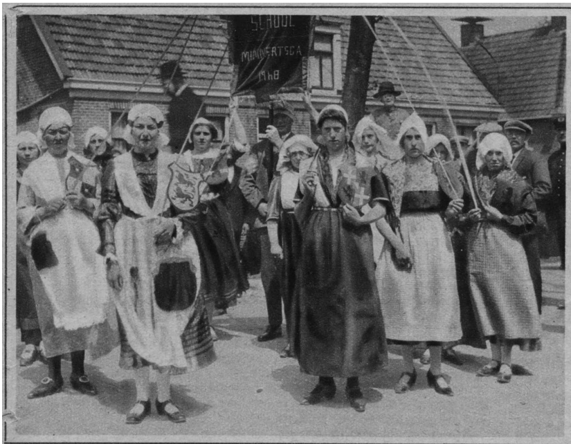
De scholen vieren feest. Ook Minnertsga wilde niet achterblijven en organiseerde een schoolfeest, dat gezien de foto, zeker goed geslaagd genoemd mag worden. Een groep Grooten, voorstellende de elf Provinciën.