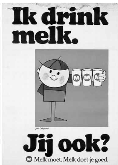
Reclame uit de jaren '60 van de vorige eeuw van Joris Driepinter

Minnertsga. De Konkelswei te Oosterbierum was ook verbreed in verband met de toenemende tuinbouw. Als belangrijke industriële uitbreiding wordt genoemd de spuitbussenfabriek in Sexbierum. Het bedrijf groeide in anderhalf jaar tijd van 10 naar 30 werknemers, maar met de uitbreiding werd verwacht dat dit wel 50 konden worden. In Oosterbierum was de patatfabriek van Fa. De Vries gereed voor productie. Ook de middenstand was niet achtergebleven. Minnertsga kreeg een nieuwe meubelzaak en een rijdende SRV-zelfbedieningswinkel.