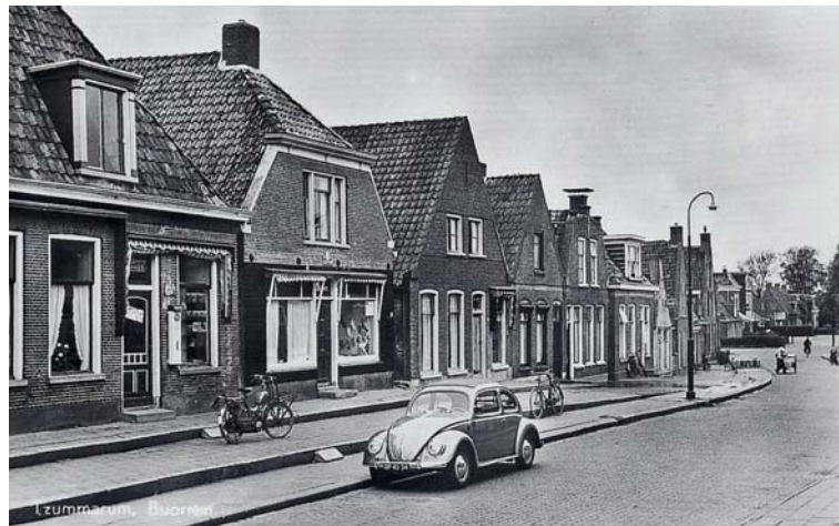
Rond 1960 nog volop middenstand in Tzummarum

komen, doch een industriehaven was niet geschikt vanwege te weinig diepgang. Eigenlijk zou je met zo'n man de zaak nog eens moeten evalueren. Verderop in de krant een artikel over de streekverbetering Barradeel waarbij in de tuinbouwvoorlichting de volgende onderwerpen worden belicht: mechanisatie bloembollen, witlof- en spruitkoolteelt, berekening van vollegrond groenteteelt. Bij s. Andringa in Oosterbierum wordt een demonstratie gehouden van mechanisch plukken van spruitkool. Op huishoudelijk gebied worden er kookcursussen in Minnertsga, Tzummarum, Oosterbierum en Sexbierum. En in Pietersbierum, Wijnaldum en Tzummarum worden cursussen Gasten ontvangen gehouden.